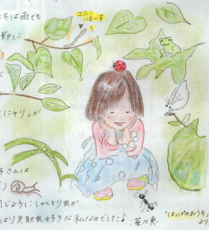
「は。は。のおうち」より

しゃくとり虫が! きと林さんは子どもたちと同じようにしゃくとり虫が大好きに違いない! と勝手に確信しているせはり尺取虫好きだ和乃のてけ♪ : 葉々鬼