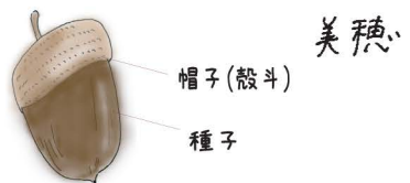
ひろひろの森の木の実たち。 ミズナラ (水柵)